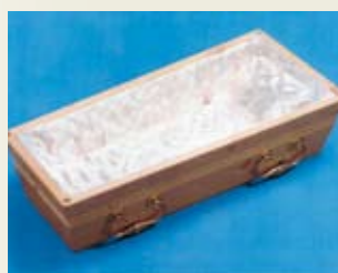
Barnekiste – polstret underkiste