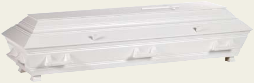
Standard med trehåndtak – hvitmalt furukiste med profiler og kors.