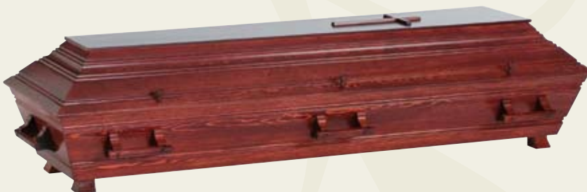
Palisander – høyglanspolert palisanderbeiset furukiste med profiler, kors og trehåndtak.

Alle spesialkister leveres med innvendig silketrukket lokk.