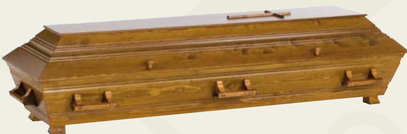
Eik – klarlakkert eikebeiset furukiste med profiler, kors og trehåndtak.