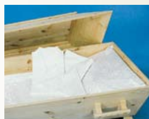
Enkel natur – løst laken