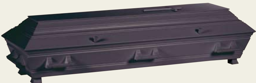
Fritt fargevalg – alle standardkister kan leveres i valgfri farge.