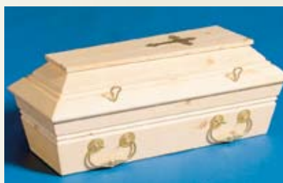
Natur – halvblank lakkert

Barnekister kan leveres i valgfri farge.