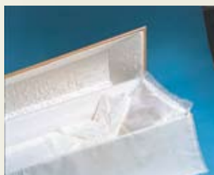
Spesialkiste – silketrukke lokk