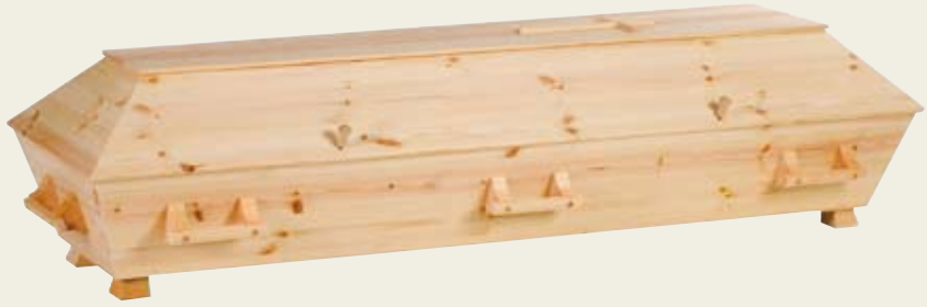
Enkel natur – ulakkert og upusset furukiste uten profiler med kors og trehåndtak.