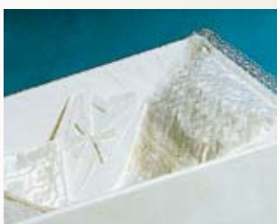
Standard – stiftet bomullslaken