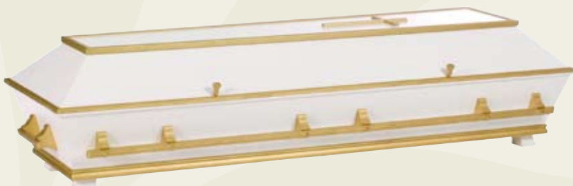
Dekor gull – hvitmalt furukiste med profiler, gullfargete lister, kors og trehåndtak.