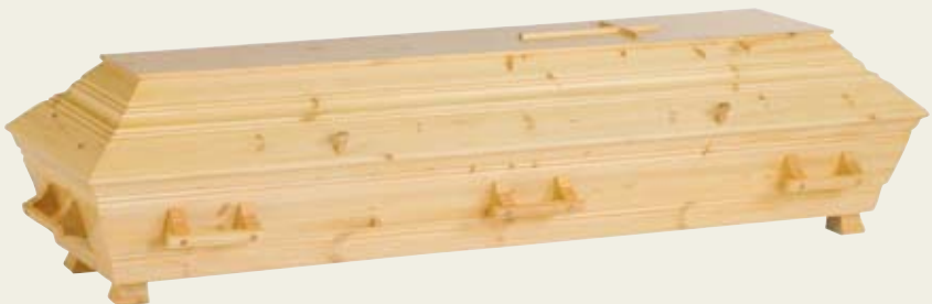
Natur – klarlakkert furukiste med profiler, kors og trehåndtak. Leveres også i ulakkert eller lutet utførelse.