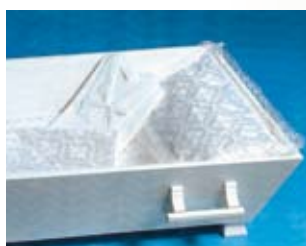
Enkel hvit – halvt beheng