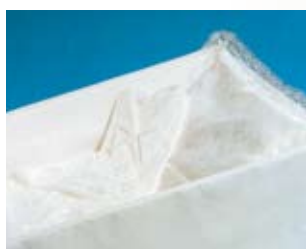
Standard – beheng i blomstret svanedun og taft

Alt innvendig utstyr i våre kister er av nedbrytbare materialer og tilfredsstillende kravene i §29 i forskrift til "Lov om kirkegårder, kremasjon og gravferd".