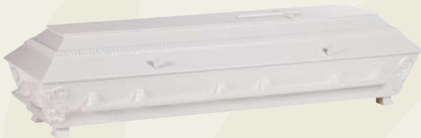
Ornament – hvitmalt furukiste med utskårne lister, hjørnedekor, kors og trehåndtak.