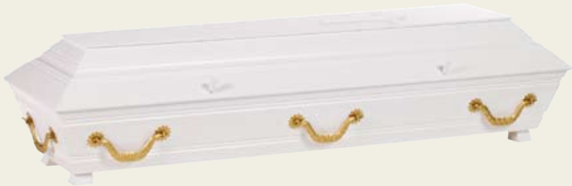
Standard med hengehåndtak – hvitmalt furukiste med profiler, kors og gullfarget metallhåndtak.