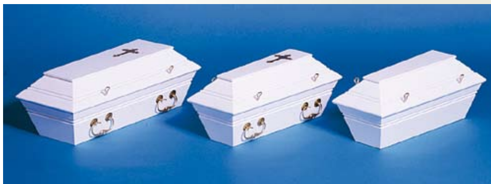
Hvitmalte – minste størrelse med og uten håndtak