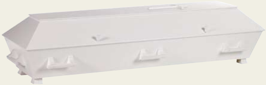
Enkel hvit – hvitmalt furukiste uten profiler med kors og trehåndtak.